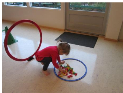
2 ára börn í þrautabraut og ná í dýr í fyrirfram gefnum litum