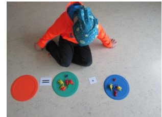
Samlagning og fundið viðeigandi tölustaf