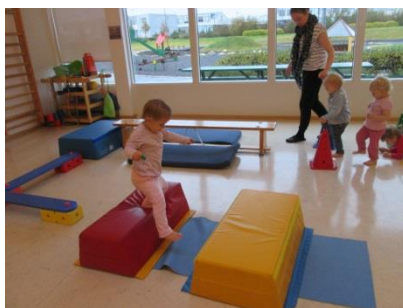
Börnin fara með dýrin í gegnum brautina