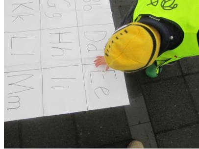
Útiverkefni - Tappar með bókstöfum

Í október og nóvember 2015 hittust leikskólastjóri, verkefnastjóri Holtakots og einn fulltrúi frá hverri deild 1x í viku og fóru yfir markmið og skipulagningu. Þessir fundir voru mjög góðir og