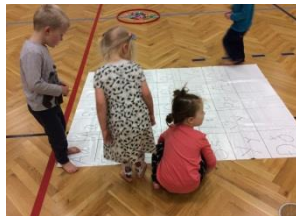
Unnið með bókstafi