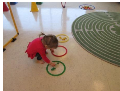
Í lokin flokka þau dýrin eftir lit

Elstu tveir árgangarnir kynntust Leikur að læra veturinn 2014-2015. Þá var börnunum skipt niður í minni hópa og fóru í salinn 1x í viku. Það var farið í skipulagða hreyfingu í bland við Leikur að læra.