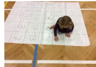
Finna réttan tölustaf á dúk