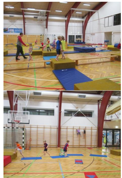
Prautabraut í sal Álftanesskóla