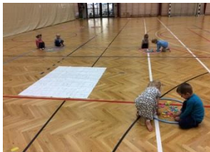
Leikur að læra í sal Álfþanesskóla

Í apríl og maí er hugmyndin að vera með Leikur að læra í útiveru.