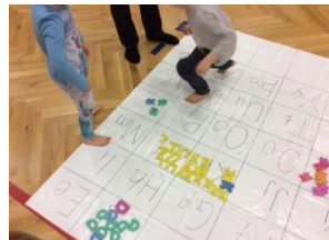
Finna réttan staf á dúk